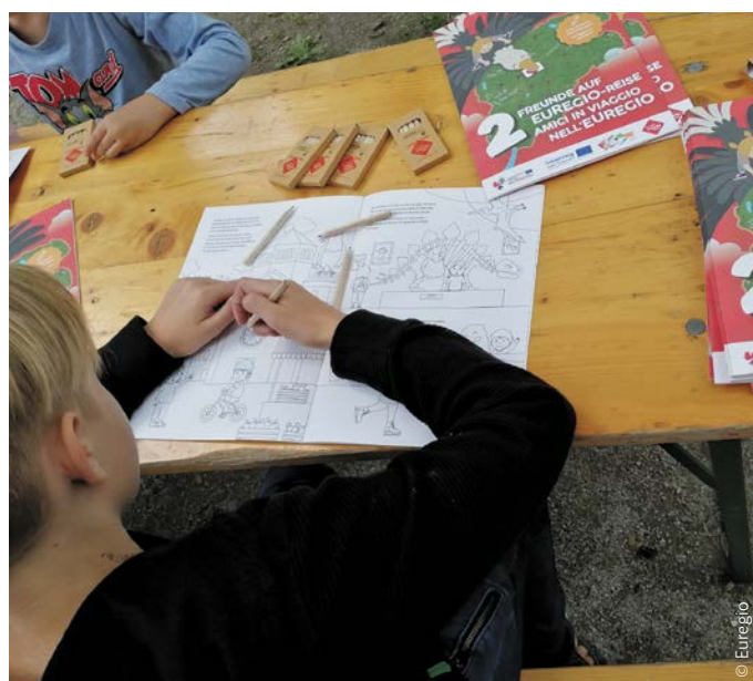
Il team dell'EuregioFamilyPass informa su iniziative transfrontaliere e eventi per famiglie.