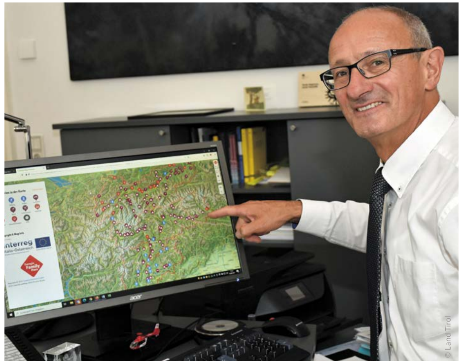
Tiroler-Familienlandesrat Anton Mattle präsentiert noch während der Tiroler Euregio-Präsidentschaft die interaktive Landkarte.

L'assessore per la famiglia del Tirolo Anton Mattle presenta la mappa interattiva durante la presidenza tirolese dell'Euregio.