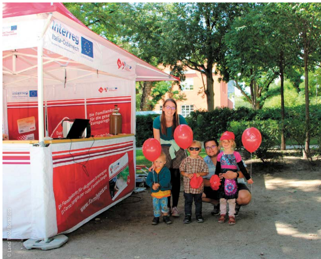
Das Team des EuregioFamilyPass berät vor Ort über grenzübergreifende Aktionen und Veranstaltungen für Familien.

Im Jahr 2017 wurde der EuregioFamilyPass als gemeinsame Familienkarte für die gesamte Europaregion Tirol-Südtirol-Trentino initiiert. Dieser bietet dir und deiner Familie über 1.000 Vorteile in allen drei Ländern. Damit lässt sich die gesamte Euregio gemeinsam auf vielfältige Weise entdecken – egal, ob sportlich, gemütlich, kulturell, kulinarisch oder zum Shoppen. Dazu genießt ihr gemeinsam günstigere Tarife bei den öffentlichen Verkehrsmitteln und einzigartige Sonderangebote. Außerdem nimmt der EuregioFamilyPass regelmäßig an verschiedenen Familienveranstaltungen teil, wie beim EuregioFamily#Day im Muse in Trient 2019, beim Kinderfestival Bozen 2019 oder beim Festival KRAPOLDI im Park in Innsbruck 2020 und 2021. Vor Ort erhalten Familien viele Informationen sowie praktische Give-Aways. Es wurden Strandbälle, Trinkflaschen, Schildmützen, Pausenboxen, Fahrradsitzschoner und vieles mehr verteilt. Bei vielen Events war auch das EuregioFamilyPass Glücksrad mit dabei, bei dem Kinder sowie Erwachsene viel über die Euregio lernen und gleichzeitig schöne Preise gewinnen konnten. In den letzten drei Jahren fanden zudem tolle Sommeraktionen statt. Dabei gab es zum